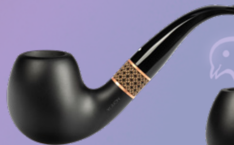
• Art.-Nr. TM 104

Unsere neue Timber – Handwerk und Tradition par excellence vereint