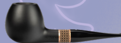
• Art.-Nr. TM 131