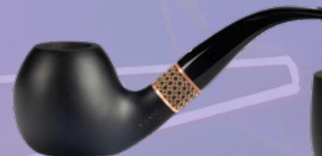
• Art.-Nr. TM 179 Standpfeife