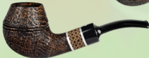
• Art.-Nr. TM 546