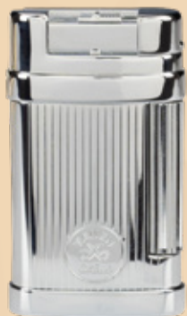
• Art.-Nr. 595