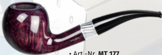
• Art.-Nr. MT 177