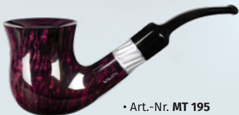
• Art.-Nr. MT 195