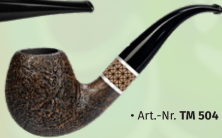
• Art.-Nr. TM 504