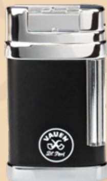
• Art.-Nr. 597