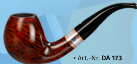
• Art.-Nr. DA 173