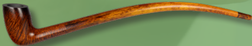
• Art.-Nr. Arondor

Pure Genussfreude – mit unserer eleganten Arondor