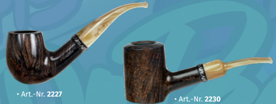
• Art.-Nr. 2227