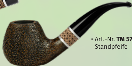
• Art.-Nr. TM 579 Standpfeife