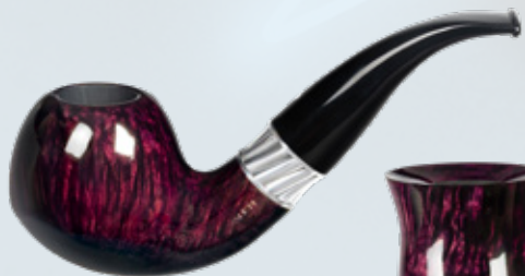
• Art.-Nr. MT 115