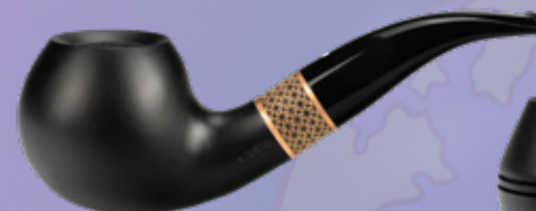
• Art.-Nr. TM 137