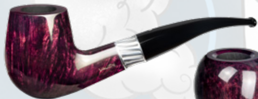
• Art.-Nr. MT 172