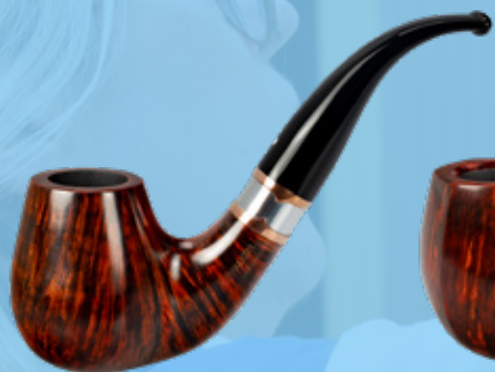
• Art.-Nr. DA 142

Unsere neue Dali – das Beste aus zwei Welten