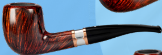
• Art.-Nr. DA 168