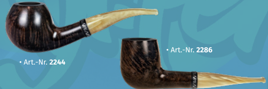
• Art.-Nr. 2244