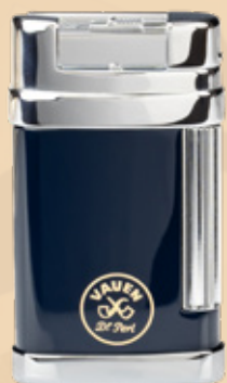
• Art.-Nr. 596