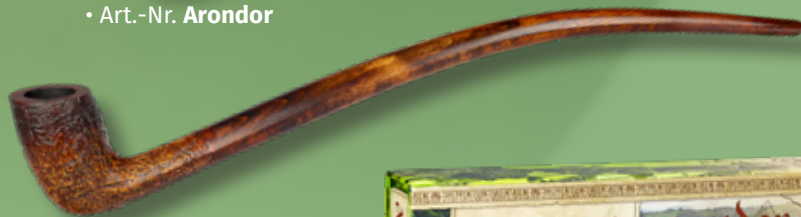
• Art.-Nr. Arondor S