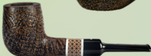
• Art.-Nr. TM 586