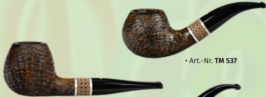
• Art.-Nr. TM 537

Unsere neue Timber – feinste Handwerkskunst trifft auf kunstvollen Genuss