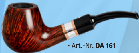
• Art.-Nr. DA 161