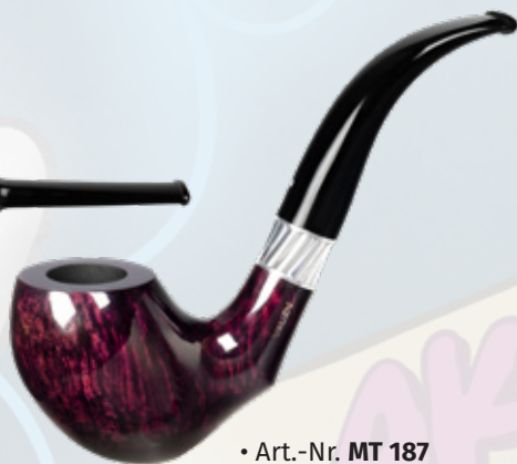
• Art.-Nr. MT 187