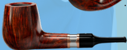
• Art.-Nr. DA 175