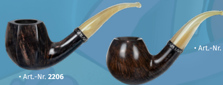
• Art.-Nr. 2206

Unsere neue Lindis – bestens geeignet für eine weite Schiffsreise – Skål!