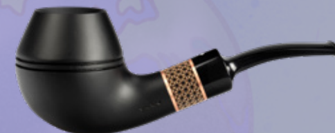
• Art.-Nr. TM 146