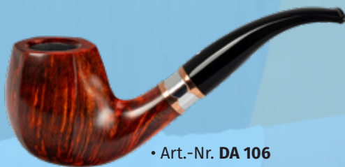
• Art.-Nr. DA 106