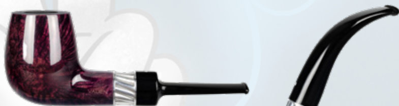
• Art.-Nr. MT 111

Unsere neue Mito – auf geht’s zu luftigen Höhen