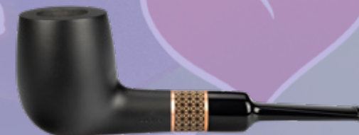
• Art.-Nr. TM 186